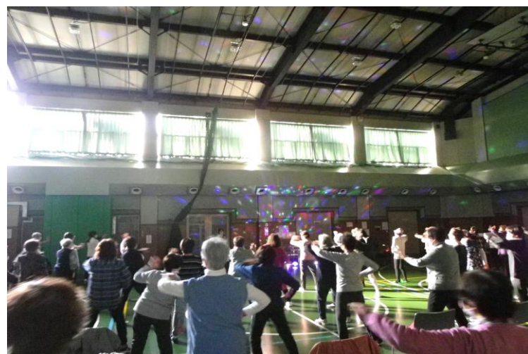
照明を消し、ミラーボールで雰囲気を出しました。