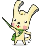
「ヨコハマ3R夢!」 マスコット イーオ

*環境のために今日からできることを楽しく分かりやすく学びましょう。マイエコバック作りも体験できます。(無料) 日時:令和5年1月30日(月) 10時~11時30分 対象:どなたでも 定員:15人(先着順) 申込み:12月12日(月)9時30分から直接施設へ。※電話申込みは10時から